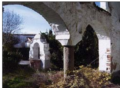
Convento de Nuestra Señora de la Concepción en Pedroche (Córdoba).

Su origen se remonta a finales del siglo XV, cuando se constituyó un beaterio de mujeres, que en 1524 pasó a ser convento. La fisonomía actual del edificio, ubicado junto a la iglesia parroquial y la ermita de Santa María del Castillo, es fruto de numerosas obras de acondicionamiento que ha sufrido el conjunto para sus distintos usos.