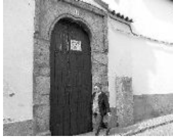
Fachada del convento de las concepcionistas, con el cartel de su venta en la puerta. ROSA GARCIA

DIARIO CÓRDOBA, 06/11/2003 FRANCISCO SICILIA